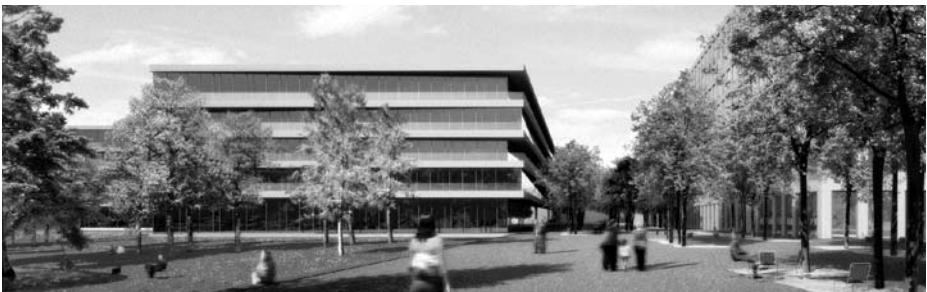
Die neue Wankdorfallee aus Osten (Fotomontage)

Der Fonds als Grundeigentümer wird die gesamte Aussenraumgestaltung finanzieren. Zur Koordination und Planung hat die städtische Liegenschaftsverwaltung eine externe Gesamtleitung beauftragt. In den kommenden Monaten soll die Siegerstudie optimiert und das Verkehrs- und Erschliessungskonzept, welches die sichere Koexistenz aller Verkehrsteilnehmenden unterstützt, überarbeitet werden. Mit der Realisierung soll parallel zum Baubeginn der übrigen Projektentwickler im Jahre 2011 begonnen werden. Das Projekt für den Aussenraum mitsamt Erschliessungsstrassen muss bis ins Jahr 2013 zur Hauptsache umgesetzt sein.