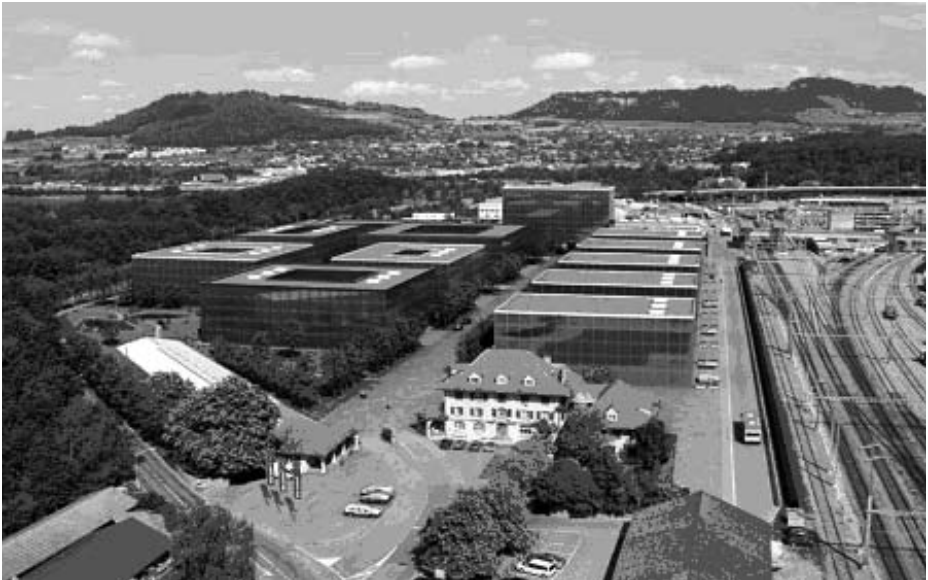
Luftaufnahme des zukünftigen Stadtquartiers WankdorfCity aus Westen (Fotomontage)