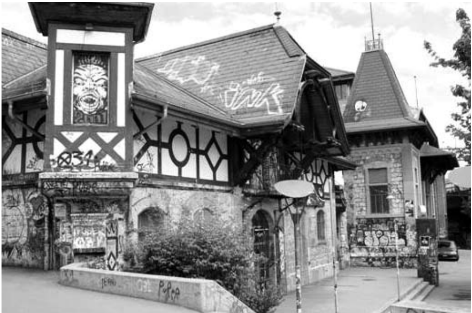
Gesamtansicht der Reitschule von der Neubrückstrasse